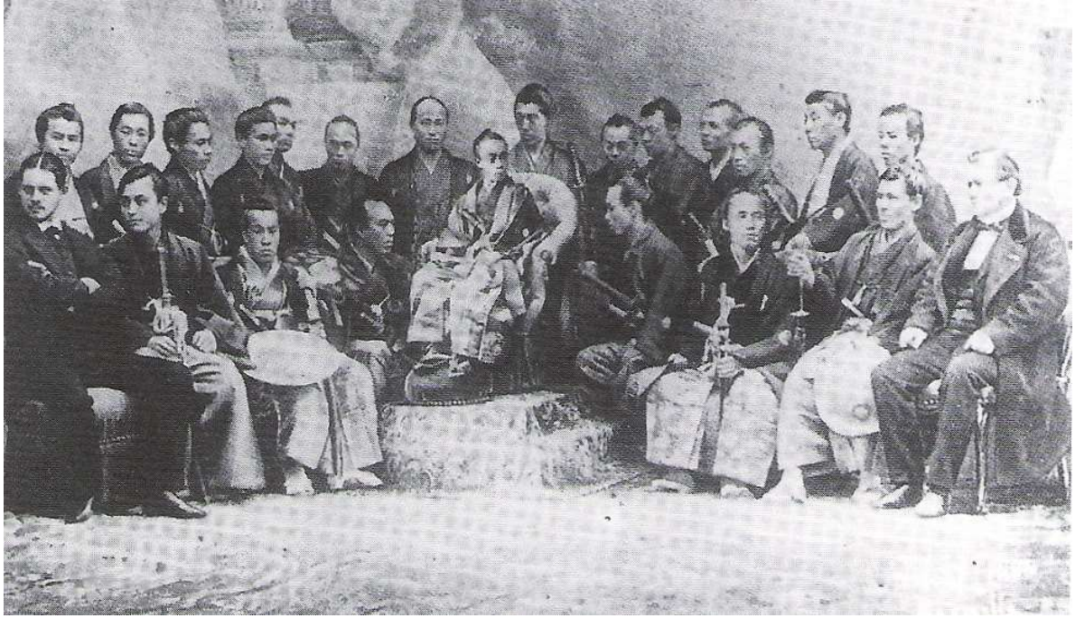
1867年(庆应3年)跟随德川昭武启程法国(巴黎世界博览会使节团)